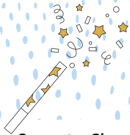
Computer Class Graduates