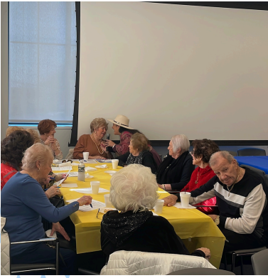
2nd Anniversary of the East Boston Senior Center Dec. 2